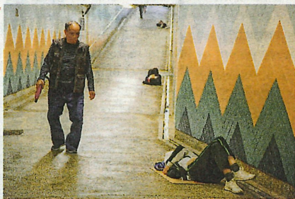
不少路人向躺在地上的同學投以奇怪目光，有同學睡時背向行人或直接拿衣物或手臂擋住臉孔。