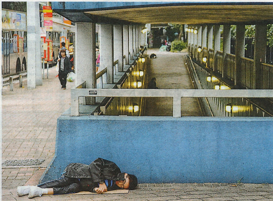
活動安排同學睡在露宿者常出沒的天橋和行人隧道等。