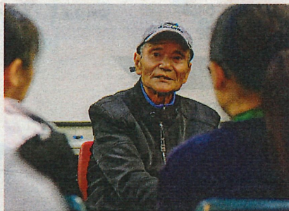
73 歲的根叔（中）曾經在大角嘴露宿逾 5 年。